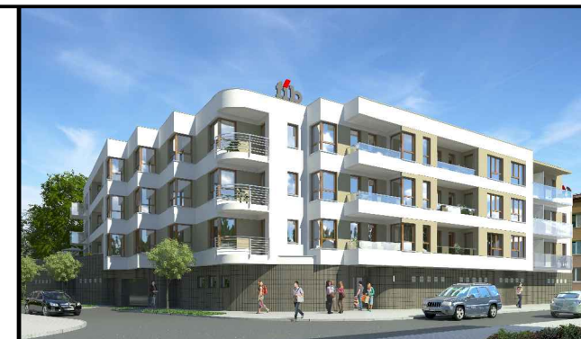
Grodzisk Mazowiecki ul. Limanowskiego