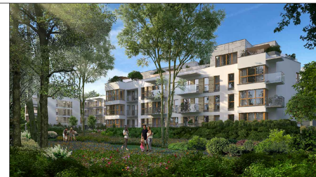
Pruszków, ul. Pawia