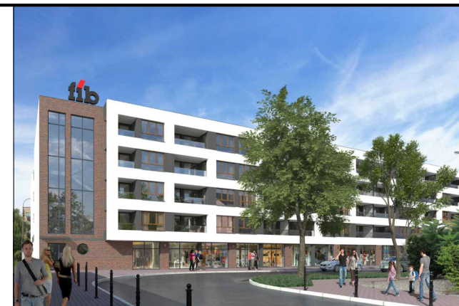
Grodzisk Mazowiecki ul. Obrońców Getta 19/27

CLB spółka z o.o. spółka komandytowa 05-825 Grodzisk Mazowiecki ul. 11 Listopada 11