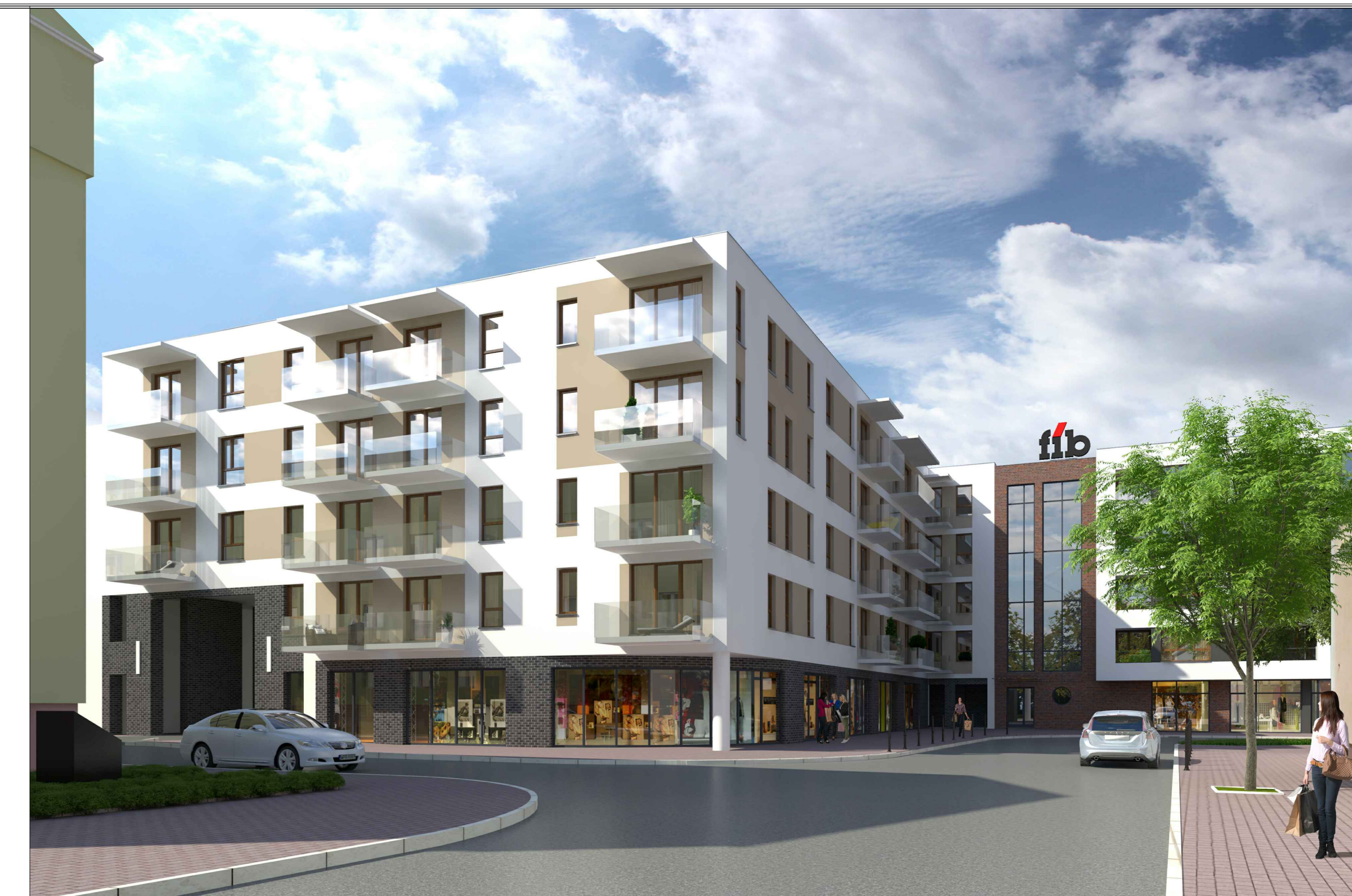
Grodzisk Mazowiecki ul. Obrońców Getta 13/17